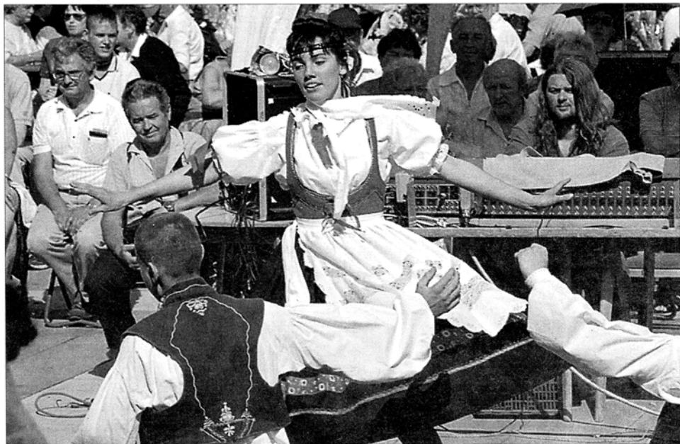
Tanečníci a muzikanti souboru Soběslavská chasa mladá vystupují na náměstí v Soběslavi