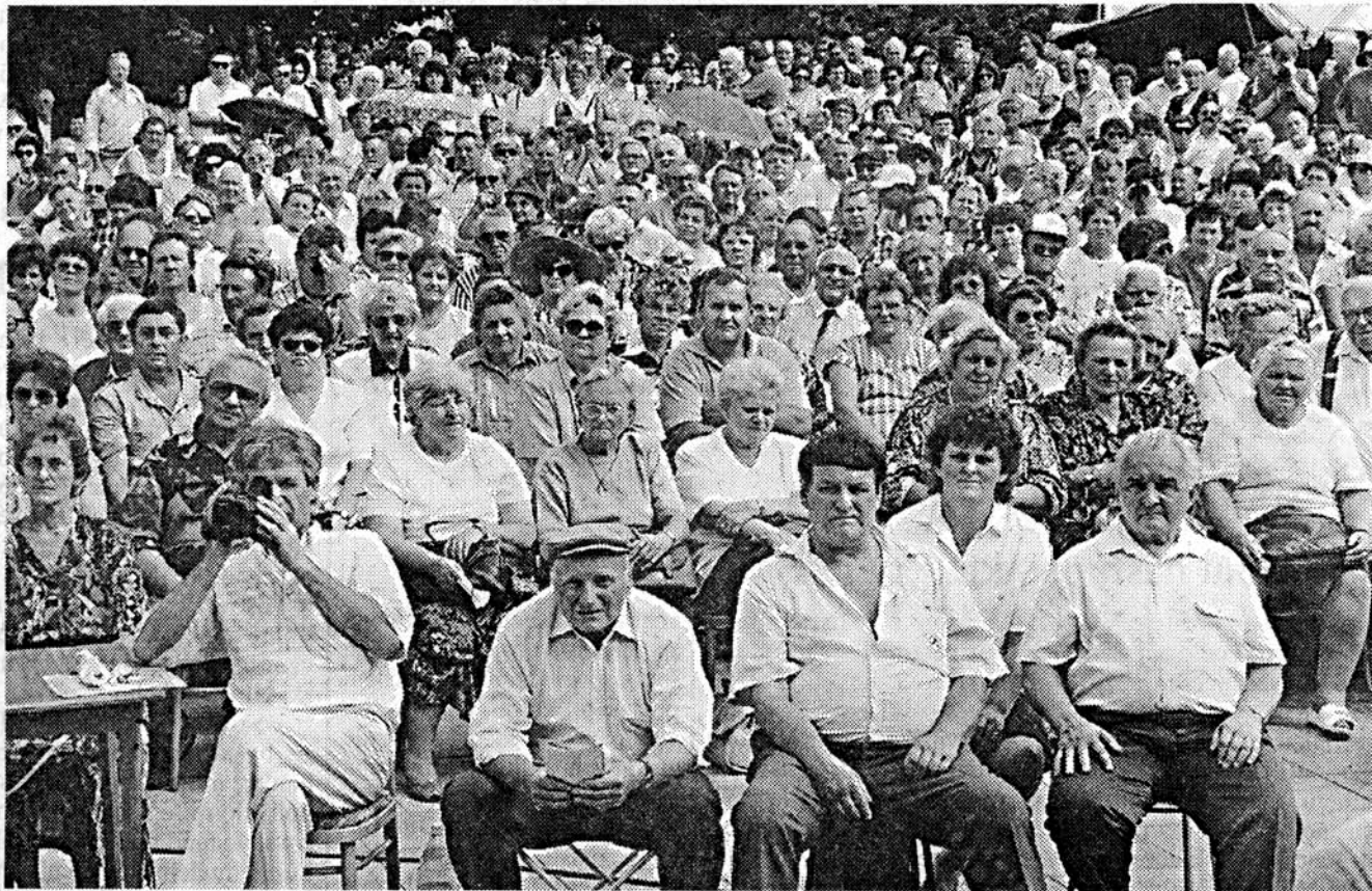
Ani úmorné vedro neodradilo množstev diváků, kteří si v neděli odpoledne přišli na soběslavské náměstí poslechnout své oblíbené dechovky.