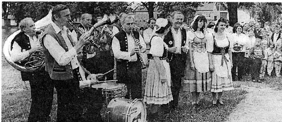
Na mažické návsi vyhrává dechová kapela Veselka.

V 10 hodin vystoupí Blatácký soubor ze Ševětína, ve 13 hodin dětský folklórní soubor Rosnička ze Soběslavi a ve 13.30 soubor Sdružené obce Baráčníků z Jindřichova Hradce. Vystřídá ho ve 14.15 Podhoranka z Trhových Svinů, ve 14.55 vystoupí Hrádecká kapela z Hrádku u Rokycan a v 15.35 dudácký a taneční soubor Jitra ze Soběslavi. V 16.05 zatančí folklórní soubor Soběslavská chasa mladá, v 16.45 uvidíte Strahovanku z Prahy a v 17.30 zahraje Moravěnka z Brna. Od 20 do 24 hodin zahrají na náměstí k tanci a poslechu Strahovanka, Ladovanka, Božejáci, Galánečka a Veselka.