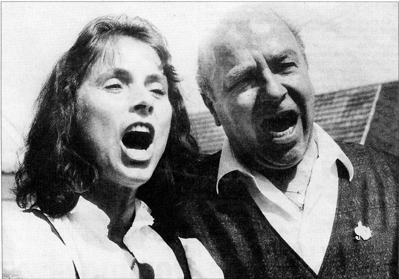
Na festivalu Blata se baví nechyběli ani hosté ze zahraničí. Například v Mažicích se představila švýcarská dechovka Eulachmusikanten.