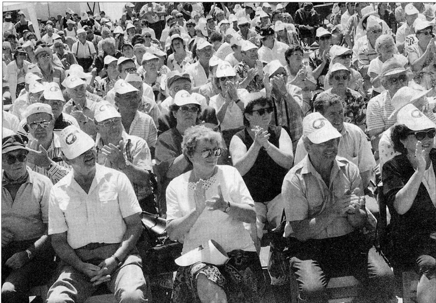
Losování čtenářské soutěže Tábořských listů Blata se baví, bavte se i vy, stejně jako vystoupení folklórních souborů, sledovaly v neděli na soběslavském náměstí stovky lidí. Jako ochranu proti úpornému slunečnímu žáru, který o sobě dával celý víkend vědět, pořadatelé rozdávali papírové čepičky s emblémem festivalu.