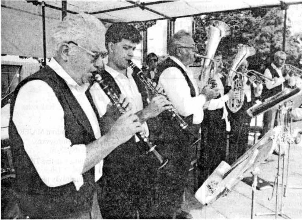
Jednou z kapel účinkujících o víkendu na Soběslavsku byla Rolnička, milovníkům dechové hudby známá z rozhlasu.