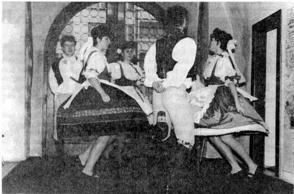
Rozevláté sukně dívek v blatských krojích . . .