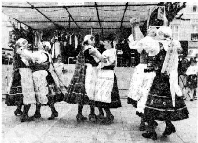
na volném prostranství tančily folklórní soubory,