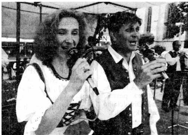
Zatímco na pódiu se střídali zpěváci,

V neděli byla na 2. festivalu dechových hudeb v Soběslavi vylosována jména výherců soutěže Blatskou stezkou. V dnešním čísle Tábořských listů přinášíme seznam dvaceti šťastlivců (blatská stavení Soběslavska poznalo celkem šedesát sedm čtenářů Tábořských listů) a zároveň fotografie z vydařeného odpoledne. (Strany 9 a 10)