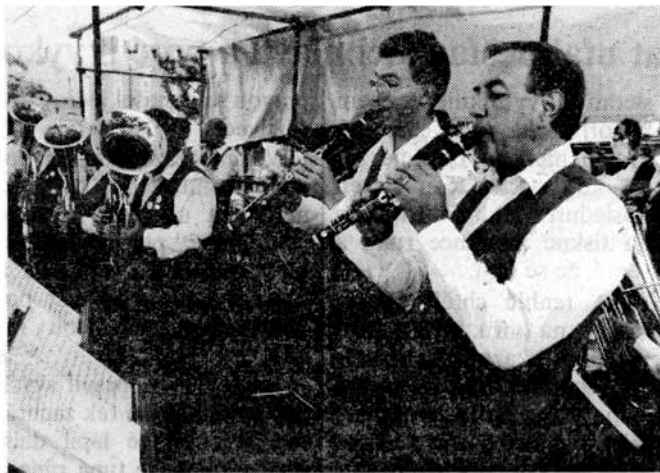
a jásaly klarinety s křídlovkami,