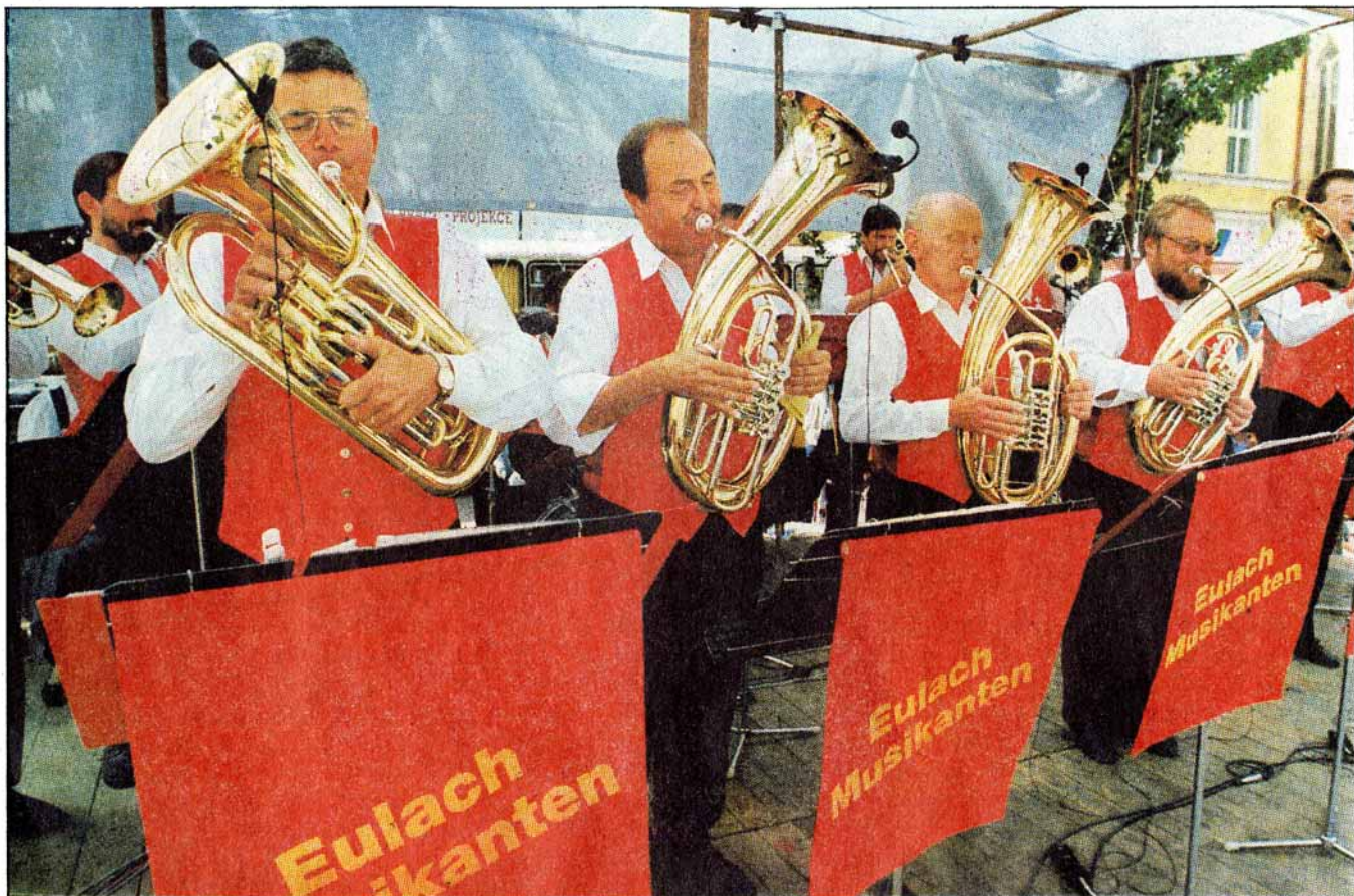
Mezi třináct kapel, které nedávno vyhrávaly na 2. festivalu dechových hudeb v Soběslavi, přijali od Ladislava Kubeše pozvání i jeho muzikantští kolegové ze Švýcarska.